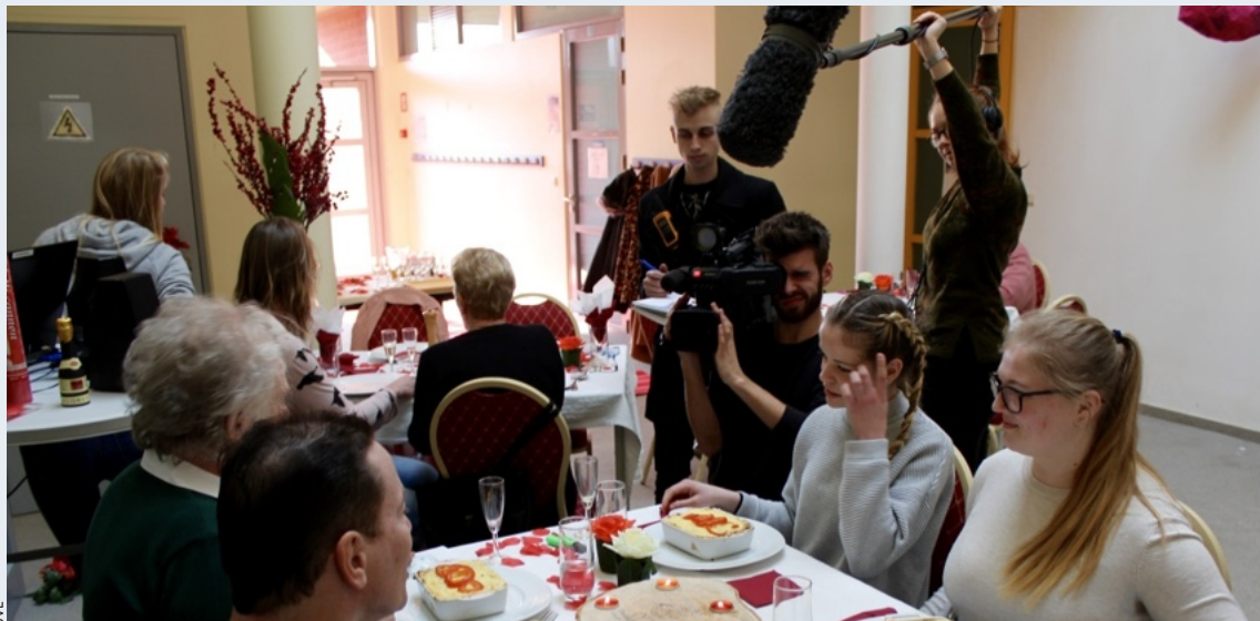
■ De leerlingen konden dankzij het project ook heel wat vakoverschrijdende doelen halen.